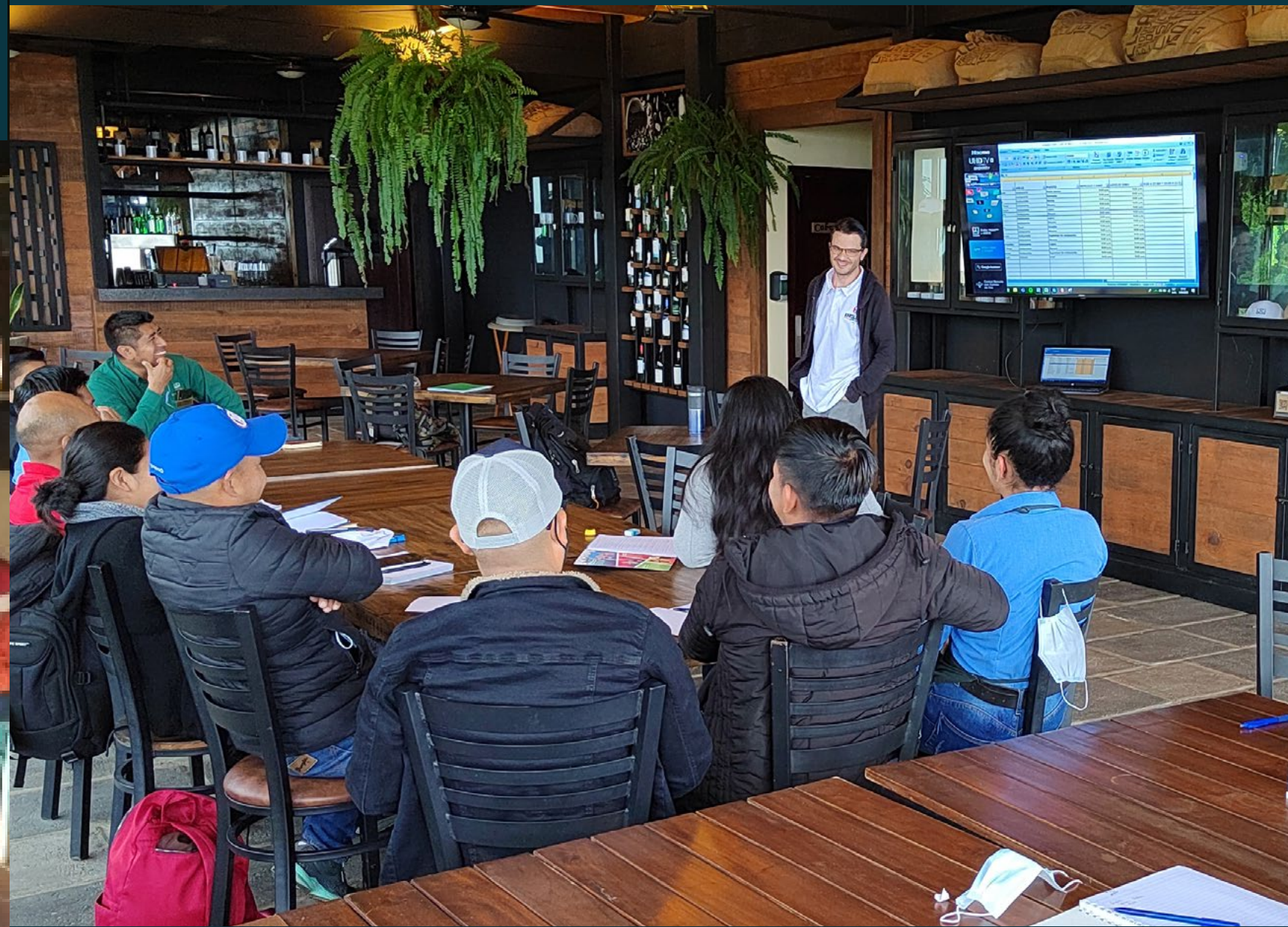
FINCA SAN CAYETANO