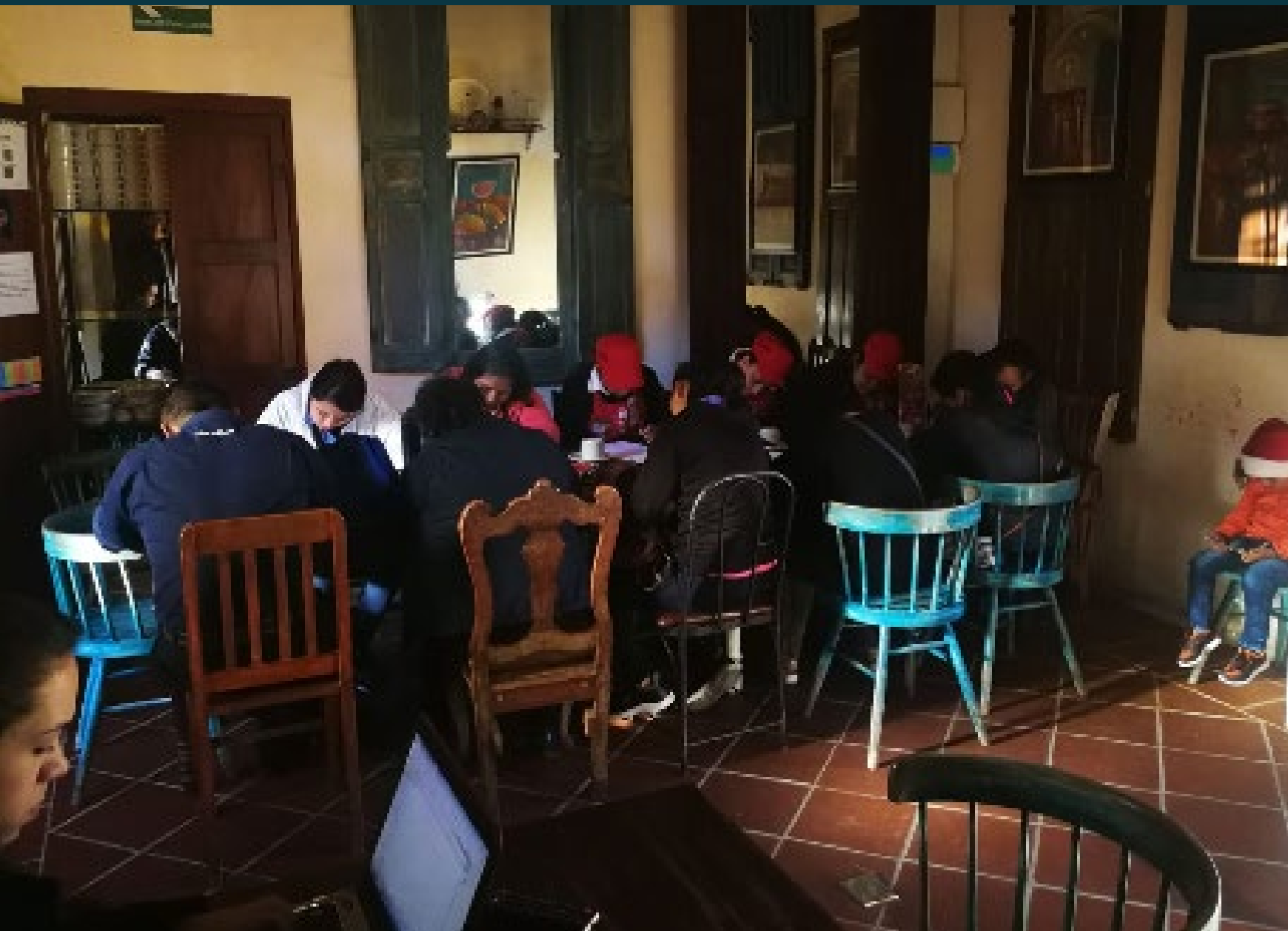
SAN MARTÍN ANTIGUA